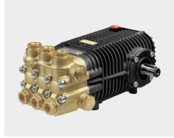
TW Premium Self-priming pump. Pompa autoadescante.