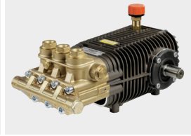
TW 500 Premium