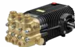
SW / TW Premium